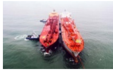
PVGAS Trading: Dự báo tiếp nối thành công trong năm 2022