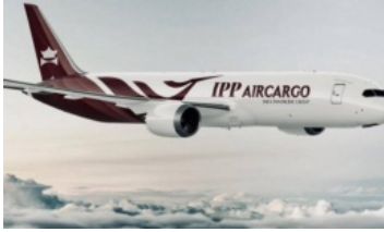
Yêu cầu IPP Air Cargo chứng minh là doanh nghiệp 100% vốn Việt Nam

Thời điểm vàng cấp phép hãng hàng không mới?