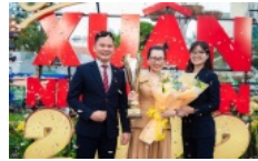
Novaland và đối tác phân phối "hợp lực phát triển"