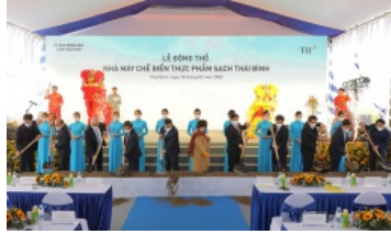
TH động thổ Nhà máy Chế biến thực phẩm sạch ở Thái Bình