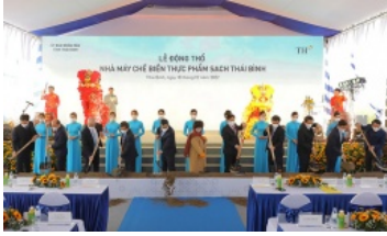
TH sản xuất tương cà; TTF đầu tư sang Singapore; hàng không mở bán vé bay quốc tế