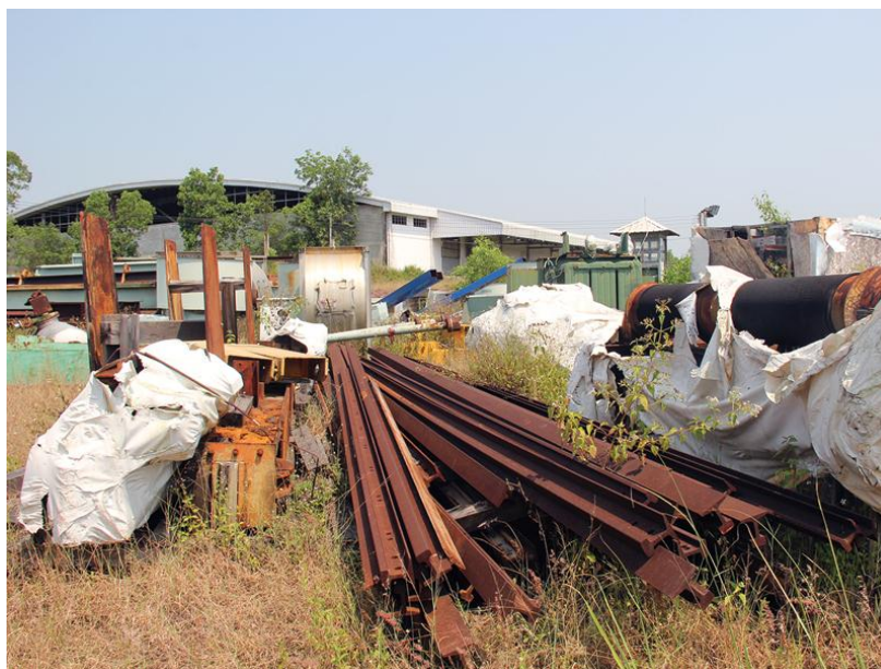
"Bãi" thiết bị, máy móc của Dự án Nhà máy bột và giấy Tân Mai Quảng Ngãi.

Có lẽ, gần chục năm về trước, khi "đáp chuyến tàu" về với Quảng Ngãi, Tân Mai không thể ngờ rằng, chuyến đi của họ lại rơi vào cảnh "nửa chừng đứt gánh", khiến mọi kế hoạch trở nên dở dang. Và càng không ngờ rằng, "suất vé" về vùng đất này lại đắt đến vậy: hơn 2.000 tỷ đồng đã giải ngân để đổi lấy một kết cục cay đắng!