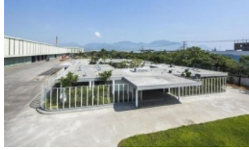
Đà Nẵng giảm 25% - 50% tiền sử dụng hạ tầng khu công nghiệp cho doanh nghiệp

Đầu đầu với bài toán tuyển dụng lao động