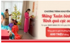
Dai-ichi Life Việt Nam triển khai hai chương trình khuyến mại đặc biệt