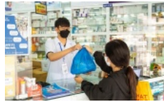
FPT Long Châu: 10 dược sĩ tham gia khóa đào tạo chứng chỉ được bệnh học quốc tế