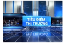
Chương trình truyền hình "Tiêu điểm thị trường" chính thức lên sóng VTC

Báo điện tử Đầu tư, thuộc nhóm báo của Báo Đầu tư