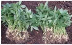
Công ty MHG và giấc mơ đưa "sản vật quốc gia" sâm Ngọc Linh vang danh thế giới